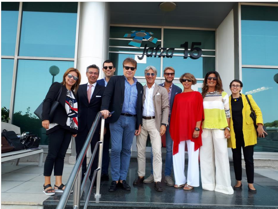
(Delegazione JIACC a Dubai, Settembre 2018)