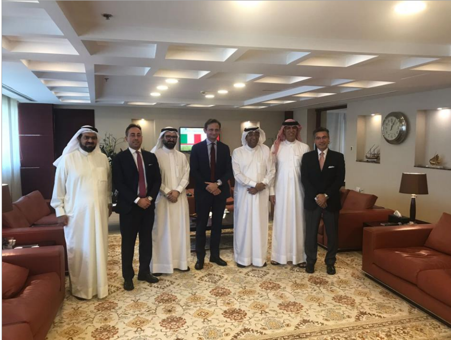
(Delegazione JIACC in Bahrein, Aprile 2018)