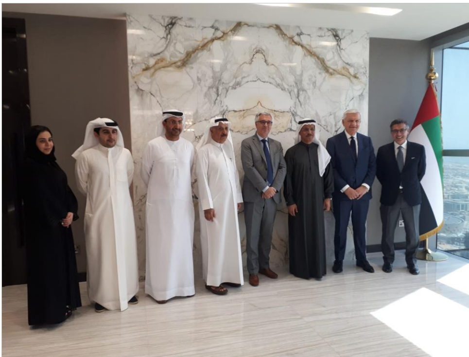
(La delegazione JIACC con S.E. Sultan Al Mansoori, Ministro dell'Economia degli EAU, Febbraio 2019)