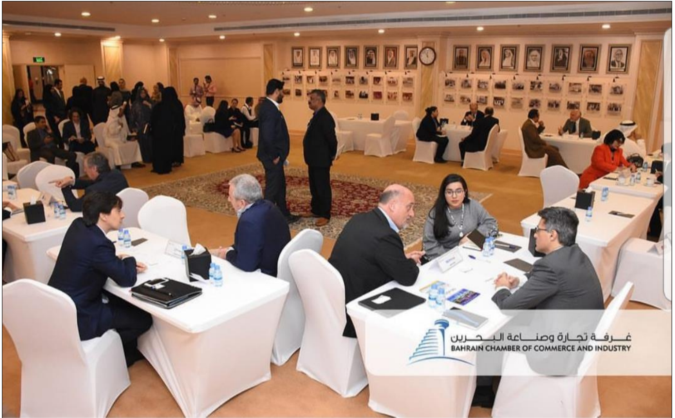
(B2B organizzati alla Bahrain Chamber of Commerce and Industry durante la Missione in Bahrein di Febbraio 2019)