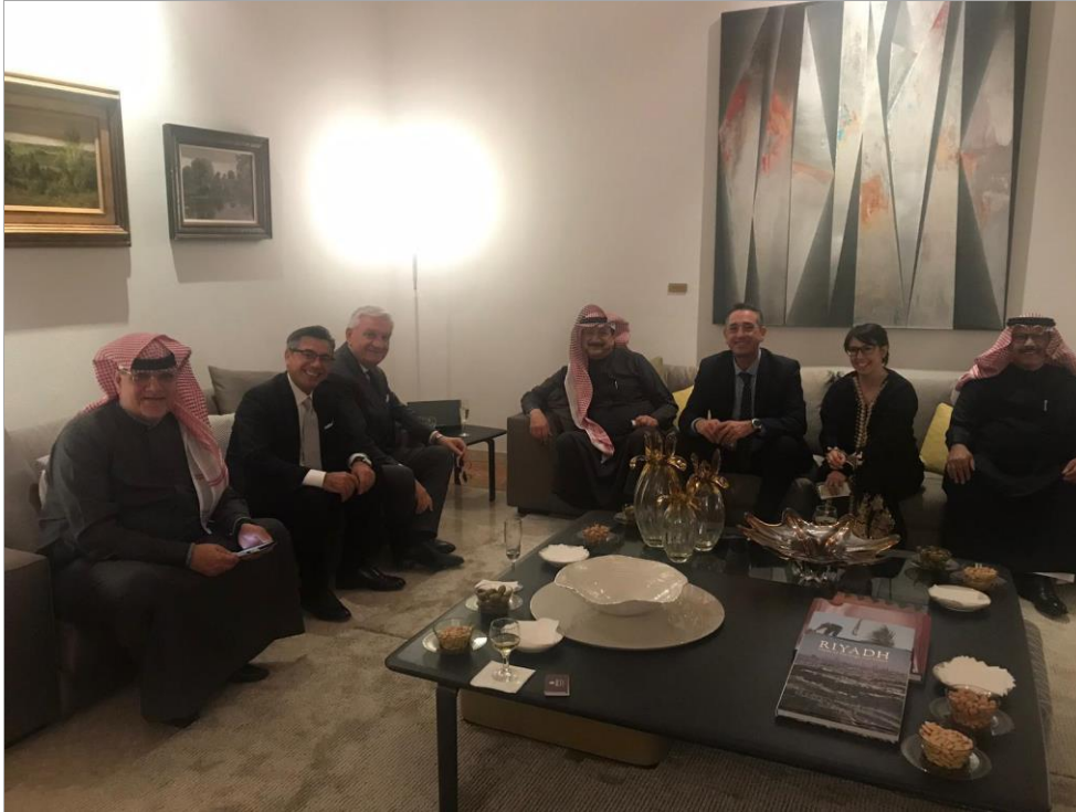
(La delegazione JIACC con le controparti in Arabia Saudita, Febbraio 2019)